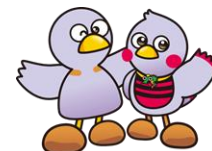
埼玉県マスコット「コバトン」「さいたまっちゃん」