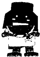
川口市マスコットキャラクター きゅぼらん